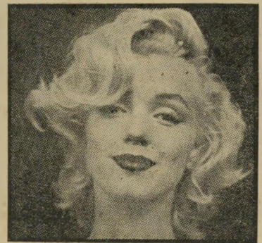
מתאבדת מונרו 5.8.1962

2.8 — יורשת המיליונים כריסטינה אונסיס, בת 27, נישאת לאזרח הסיבירי סרגיי קויוב בן ה-37, בטכס שנערך במוסקוה.