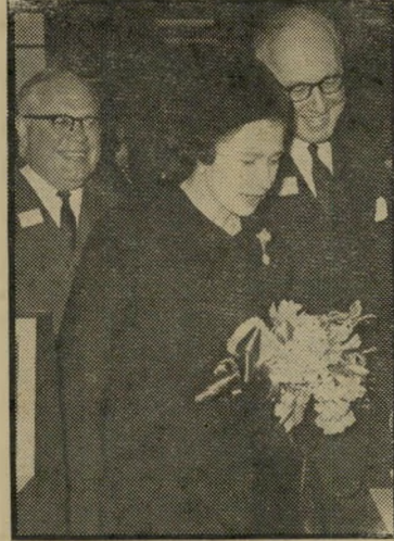
המזכה אליזבת בליווי שומר אחד

שרי ממשלת הליכוד אינם נזקקים ל-שומרי-ראש, שהרי מי הוא הכסיל שירצה לפגוע בהם? שום ישראלי לא יהיו לעשות כן, שמא