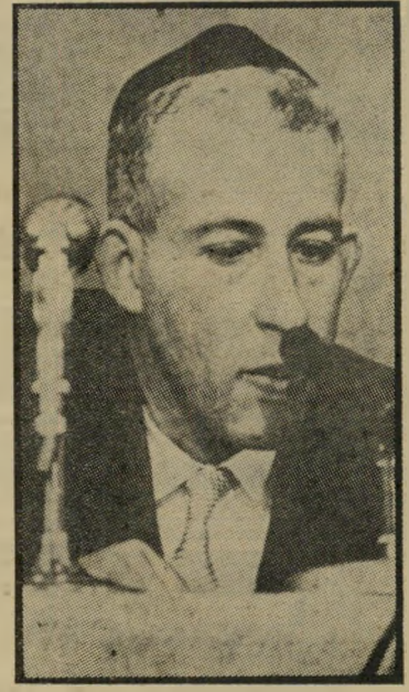
חתן חכם 4.8.1958

6.8 — הבית הלבן מודיע שפצצת-אטום הוטלה על הירושימה ביפן. האבידות: 78,150 הרטוגים, 37,425 פצועים ו-13,083 נעדרים.