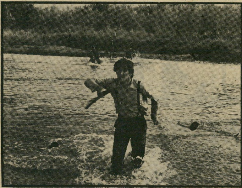
ריצ'רד גיר בתפקיד ביד הפועל (לקראת סוף הסרט) המים שהיו שמחה בתחלה מביאים את הסוף העצוב

אקורדיון ענקי. אם הכל יפה ומוציא לח כל כך, היכן הספקות? הרי מכל ה"כתוב לעיל, ברור שימים ברקיע הוא סרט פיוטי. זו אחת הפעמים הבודדות שהקולנוע המסחרי הצליח ליצור שירה של ממש על המסך (במקום הקיטש הר"מרוח בוליון, שמוזהה בדרך כלל עם שירה בקולנוע). אפשר אפילו לראות בו