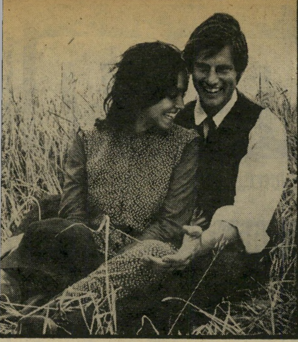
ברוק אדמס עם סם שפארד

מעשה בפועל מתכת צעיר בשקאנו, שחי עם אחותו הצעירה (המספרת את הסיפור כולו) ונערתו, שאותה הוא מציג קבל עם ועדה כאחותו, כדי למנוע רכי לויית ופספוסים, השלישיה נמלטת משי קאנו, אחרי שהפועל מכה את מנהל-העבורי. ויוצאת לעבוד בקציר, בחווה שבמרום חבי טכסאס. בעל החווה, צעיר, שהרופא מבשר לו כי הוא חולה במחלה אנושה, מתאהב בנערה, ונושא אותה לאשה. ביל, פועל המתכת, אשר שמע במקרה על מה