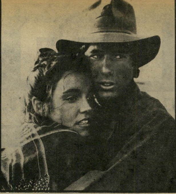
ברוק אדמס עם ריצ'רד גיר