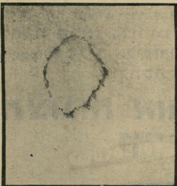
סימני הנשיכה מקרוב „נשיכה של תינוק...”