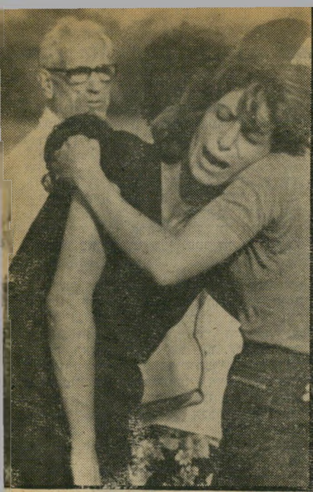
אב יחזקאל נקש התורענו בפני רצון

הגיע למקום כשבירו סכיניגילוח ואיים בהתאבדות. פעם אחרת איים לשפוך חומי צה על פניה של כרמלה. תלונות על כך הוגשו למישטרה.