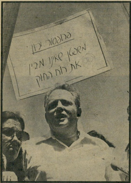
לפיד (מוז הפגנת העובדים נגד הרחת צוקרמן) חגיגה של ניצחון

וספר לו על פרשת הקצין — בעוד שהצנזורה הצבאית הכפופה לו, מוחקת כל מילה על פרשה זו הנשמעת מפי אחרים, וביכלל זה גם פסקי-הדין של שני בתי-הדין שפסקו הצבאיים שטיפלו בפרשה.