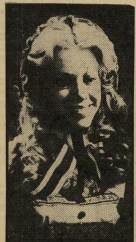
פידרפיה: כות יום שישי, שעה 9.20

הסרט הערבי של הישבוע הוא קומדיה, המספרת את אהבתו של צעיר לארוסתו.