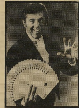
קסמים: וילסון יום שישי, שעה 3.00

סידרה חדשה במקום כן חיות, בת שישה פרקים. מפיק הסידרה והכוכב שלה הוא הקוסם מרק וילסון, הנושא את התואר הקוסם האהוב ביותר