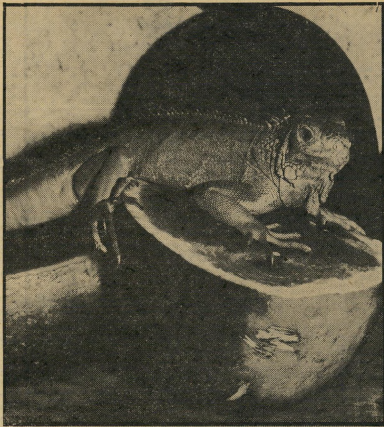
„זיקית“ של מוגנה חיות ואבטיח

תיסרוקות: „אתר היופי“ סלון ז'אק ז'ורז'ט מלון „דיפלומט“ * עיצוב הכתרים: רחל גרא יפו העתיקה * הדרכת המועמדות: בי"ס לדוגמנות „רגב“ * צילום המועמדות: אסף שילה „אולפני צילום ישראל סאן“