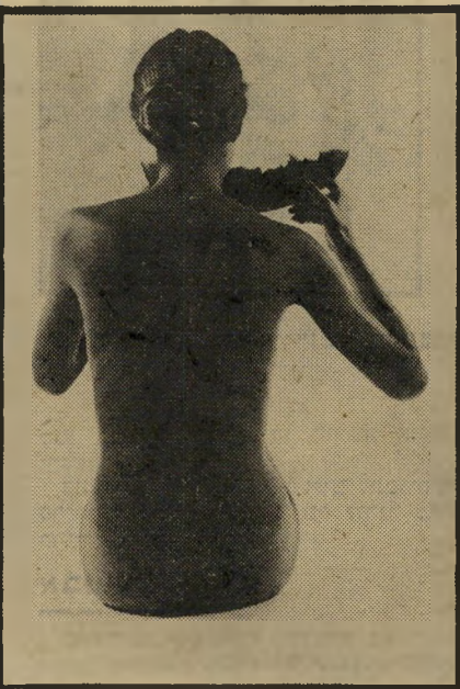
"נתח ראוי לשמו" של מגנסס מין ואבטיח

המכוונת את מילחמות העולם, וקסדת לוחם על גור עץ, סמל לקבורת הייל במילחמה, והמהווה רמז לתוצאות הבלתי נמנעות של הקרב.