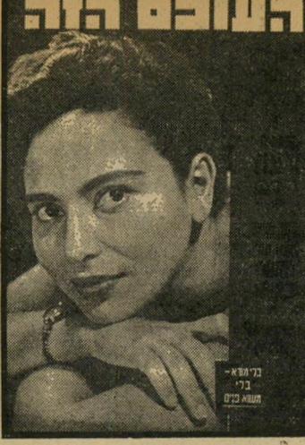
"העולם הזה" 874 תאריך: 22.7.54

ולא נבראה, כקשר עם העסקיביש שנערך באותם הימים. צוות כתבי "העולם הזה" סיקר השבוע לפני 25 שנה את אחד מראשוני הסרטים הישראליים - תחת הכותרת, "ארבעה שלחמו ונפלו על נבטה 24". המדור, "במרחב" חזה את המרידה כאל-גיוריה, הגתונה לשילטון צרפתי, ותיאר את התסיסה שהולידה את המרידה הזו.