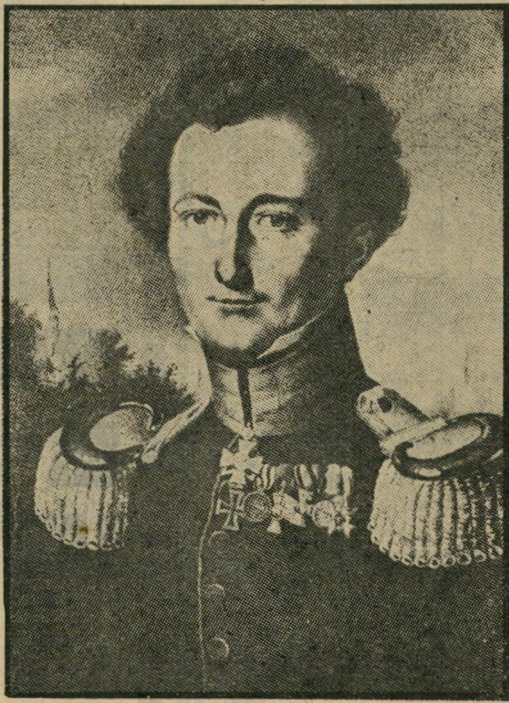
קארל פון-קלאוזוויץ: דבר שאין להרשותו

למשל, אם נקבע כי היעד העליון הוא השגת שלום עם העם הפלסטיני, תוך החזרת שטחים אלה במוקדם או במאוחר, בצורה זו או אחרת — הרי נובעת מכך תפיסה ביטחונית מסוימת. פני תפיסה ביטחונית זו, ישוב כמו אלוף-הצבא.