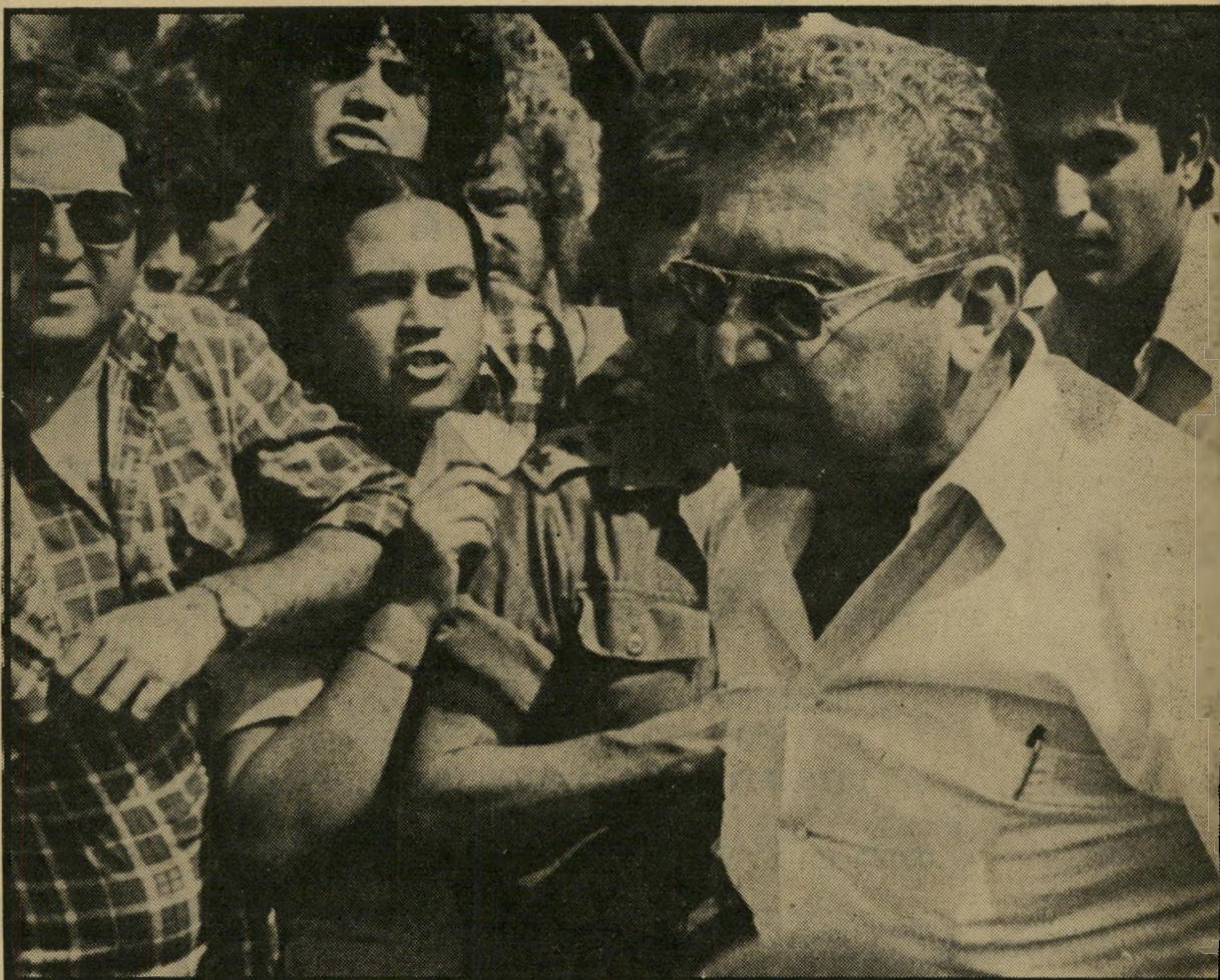
מיכ"ב כהן יורקת בפני עזר וייצמן בגן-הירק שר נאות-סיני שלוש יריקות