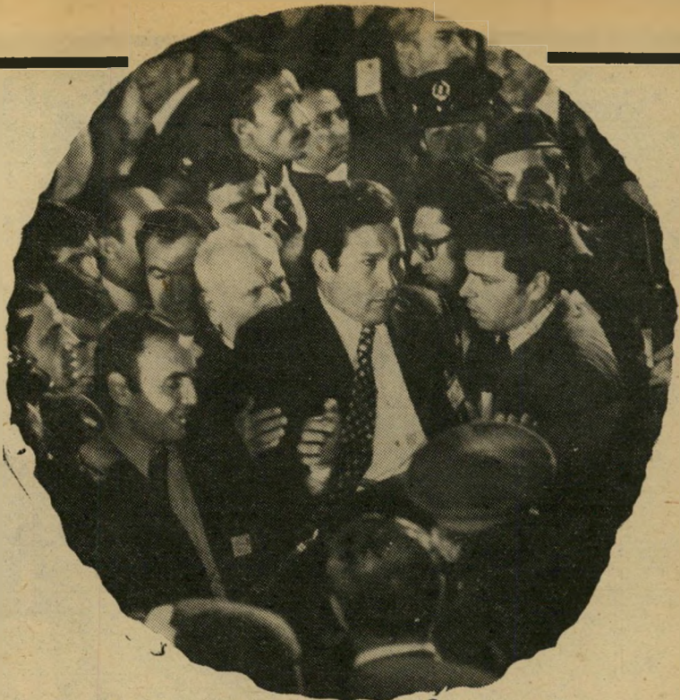
גוריות ישראליות ומצריים סביב הנשיא קציר שתי אסכולות