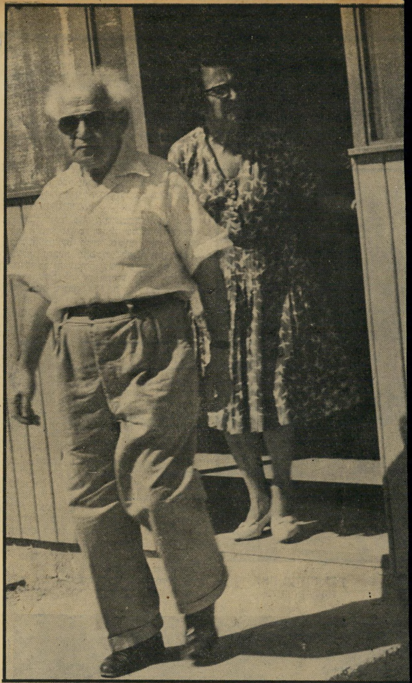
פולה ודויד בן-גוריון כשהם יוצאים מבני ברק

לשומרי-הראש של דויד בן-גוריון היה תפקיד נוסף, שאף הוא הוטל עליהם עלידי פולה. מדי יום, בכל מקום שבו היה בן-גוריון, היה עליהם לרדת בדיוק בשעה 10 בבוקר לחנות המכולת הסמוכה למקום הימצאו של הזקן, לקנות צנצנת