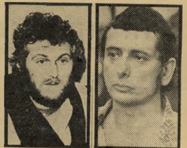
מוקד ומגלה והתגלית ויולטיר

לא התעלטה מעל לרמת תכניו הספרו- תיים, ואצבעו האמביציות שלו מעודו