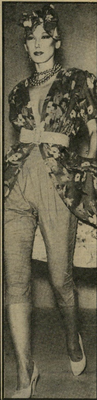
אופנה עם חיוכים בסיגנון קצב הרומבה, פרי דמיונם של האיטלקים