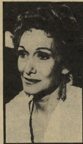
פילדלפיה: פיליפס יום שישי שעה 9.20

● יקר יותר מחיי (5.32). סרט ערבי קלאסי, תוצרת מצריים. השחקנים המי