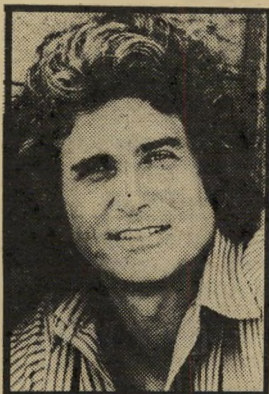
בית בערבה: לנדון יום שני שעה 5.30

● מותו של מוקיור (10.00). הפרק האחרון ב-סידרה חיי מוליי. לולי הקנאי בוגד במוליי ופונה בחשאי לכומר האישי של המלך לואי 14, ומספר לו שלואק בטיסט היתה יד בפירסום מיג'ורס אג'ר נימי נגד המלך. הוא מזומן אל המלך, אולם מתחרו ומנסה להטביע עצמו בכיתו הכפרי של מוליי. ז'אן בטיסט מציל אותו. ב-17 בפברואר 1672 מתה