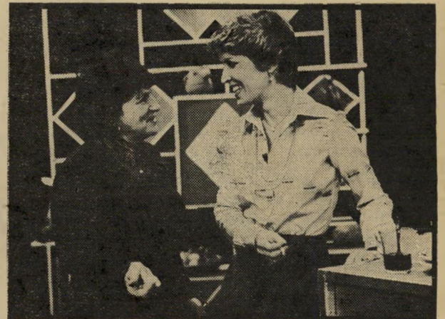
סוד כמזם: מזור ובלום יום חמישי שעה 5.30

פורסמים סלאח די אלפאקר ור שאדיה מגוללים סיפור על אהבת ילדות. שאדיה עורגים כאשר מתבגרים, עם כאבי-לב ור סיבוכים רגשיים.