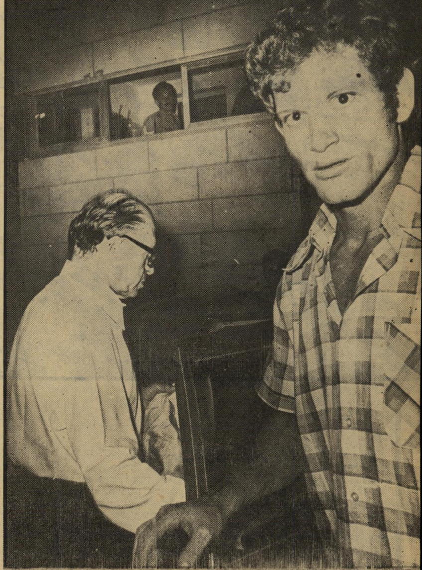
שמירה כפולה מוצבת על ראש־הממשלה מנחם בגין, כאשר הוא בביתו. בעוד בגין נכנס למכוניתו נראה שומר־ראש צמוד (מימין), ואילו מהמינה, ליד פתח ביתו של בגין, מציץ ראש של שוטר.

שיגעון שומר־הראש, או „הגורילות“, כפי שהם מכונים על־ידי העיתונאים, החל בצינעה רבה. מישרד ראש־הממשלה החליט עוד בשנת 1949 כי יש לשמור על ביטחונו האישי של ראש־הממשלה ושרי־הביטחון. דויד בן־גוריון, ושיש להצמיד אליו שומר־ראש. צעירים אחדים אומנו במיוחד לצורך זה, והוקמה חוליה של אנשי־ביטחון, שכל תפקידם היה לשמור על בן־גוריון. למרות שנשאר מאז השם „חוליה“, הרי שכיום מונה החוליה מאות צעירים, העובדי רים אימונים מיוחדים, וכל תפקידם הוא לשמור על אישים. גם הקשישים שבין אנשי החוליה, אותם שכבר פרשו ממנה ופנו לעיסוקים אחרים, נקראים ל„מילואים“ בכל פעם שכוח־האדם אינו מספיק. בעיקבות התקדים של בן־גוריון, הוחלט בממשלות הקודמות כי אל ראש־הממשלה ואל שרי־הביטחון יוצמדו שומר־ראש אי־