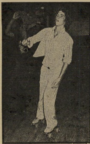
ג'ון קנדי הבן