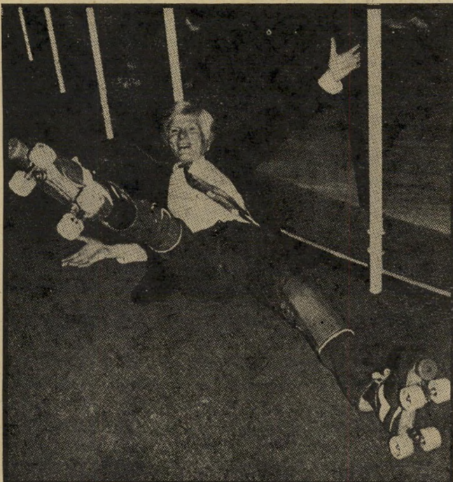
הבמאי הצייר אנדי וורהול