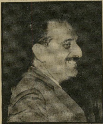
ממונה דה-ישיב, מקאהיר למשרד-החוץ

הוענק. פרס של הסרט הטוב ביותר בנושאי מדע וטכנולוגיה לסרט הישראלי בחזית הרפואה, בהפקתו ובבימויו של אילן