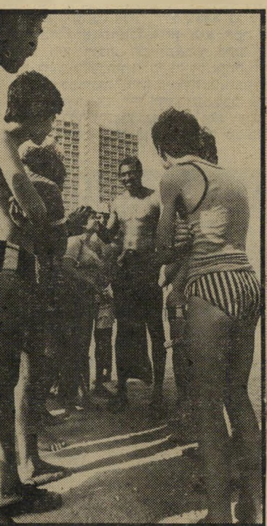
בשפת-היום הישראלים מתקיפים

יפרו לנו לפני שבאנו לכאן, על ההיסטוריה של הכדורסל הישרא-