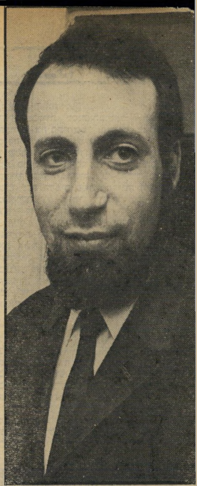
סטודנט נוף (1958) לאורך החיים הציבוריים —