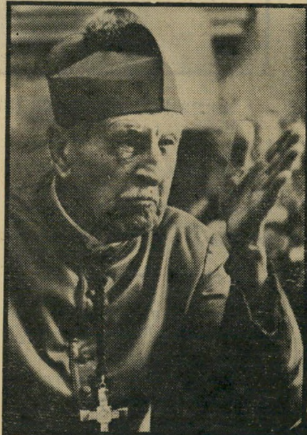
הקרדינל — ג'ין קרמווד שחקן בגיל 92

משחקים, כשמיקרופונים ניידים אל-חוטיים מחוברים לכל אחד ואינם מפריעים לתנועתם החופשית, שתי מצלמות עוקבות אחרי המתרחש. לצורך תקריב, מתחלפים את עדשת המצלמה, במקום לקרב אותה לפני השחקן ולהביא אותו במבוכה. וכי איזה שחקן לא היה שש לעבוד בתנאים כאלה?