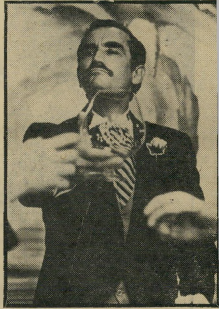
אבי החתן — זימוריו גאסמן פארודיה על מהגר

שמקצר, מתקן ובעיקר מתמצת, אם יש בכך צורך. בצורה זו, השחקן והדמות הופך כים יחידה אחת, ומת שייצא מפיו, על המסך, לא יהיה טכסט כתוב על-ידי אדם אחד, שהושם בפיו של אחר, אלא מלים שאותם היה אומר השחקן עצמו, אילו היה ההבדל מהותי וגדול. גם בהרגשת השחקן וגם בתוצאה המתקבלת על הבד. אך זה עוד לא הכל. בשעת ההסרטה מעדיף אלטמן להניח לשחקנים לנפשם. הם