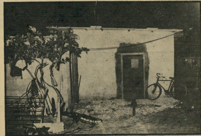
הבית שבו כוצע הרצח. האב התגרם

מוניר נידון השבוע למאסר-עולם על רצח בת-דודתו תמס. הנערה בת ה-15 ישלמה בחייה על-כך שאביה אנס אותה, ושהיא הפכה שיחת השכונה.