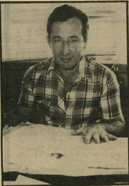
תובע ויינשטיין אהבתי את כולכם —

באותו בוקר גורלי יצא אלי לדרך, כאשר הוא מצוייד ברובה ובמיכתב התי אבדות קצר. חיון לא היו יותר חיים בלי רבקה, שעזבה אותו וסרבה להנשא לו, על כן כתב מיכתב צוואה מפורט, שבו