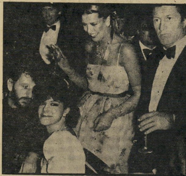
הנסיכה קרוליין ובעלה, רינגו סטאר והכלה