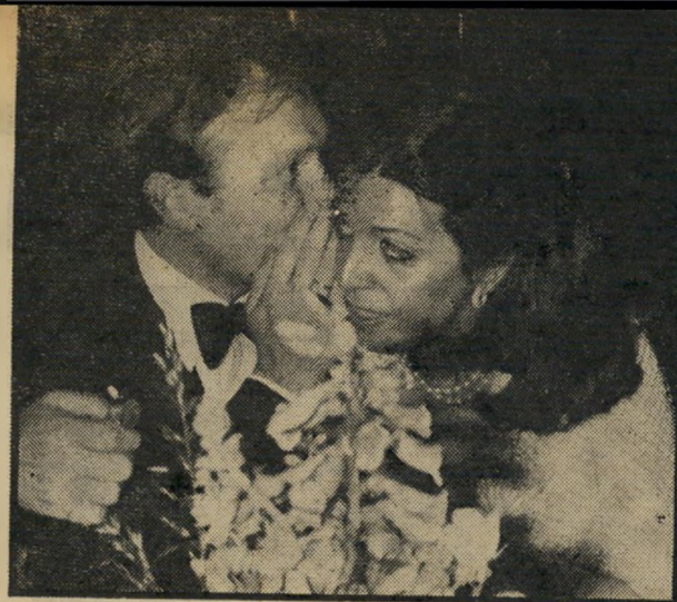
אורחים - כריסטינה אונסיס ובעלה