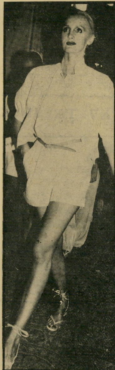
השורטס כלבוש קייץ