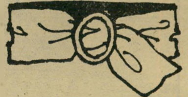
חגורת עור נאפה