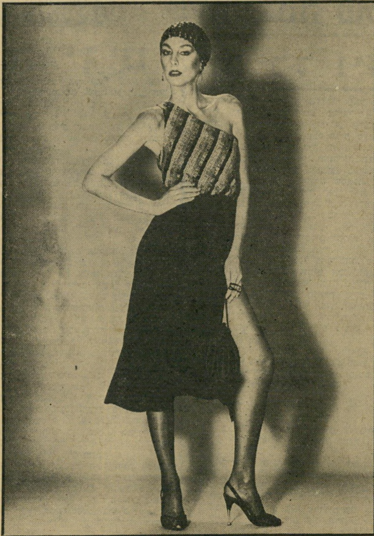
אחת ממערכות האופנה החדשות, פרי דמיונו של אוברזון

בארון. הם לא היו באופנה. מי שפרמה את מיכנסיה והפכה אותם לבוש שונה, מצפה לה תעסוקה נוספת, שכן המיכנסיים חזרו. כנראה שהלחץ היה חזק מאד, אחרת איך אפשר להסביר שמכנסיי השורטס שוב באופנה, שלא לדבר על מיכנסיים שמס- תיימים בגובה הברכיים, או מעט מעל לברך, משהו בסיגנון הספארי. גם מיכנסי פטר סן יפים בהחלט, ואם את רוצה לשמוע בעצתי, אל תיפטרי ממכנסיי החורף. הם יהיו באופנה בחורף הקרוב. אם המראה הספורטיבי אהוב עלייך אל תתביישי ללבוש מיכנסיה-תעמלות. מישחק הכדורסל הפך מזמן מוקד התעניינות כללי אצלנו, ואם את לא יודעת לשחק כדור- סל, את יכולה, לפחות להיראות כשחקנית כדורסל בעזרת מיכנסיה-הספורט וגם נעלי- ספורט. כך או כך, השנה תהיי פטורה מלענות לשאלה: „מי לובש את המיכנסיים אצלכם?“ רואים, לא?