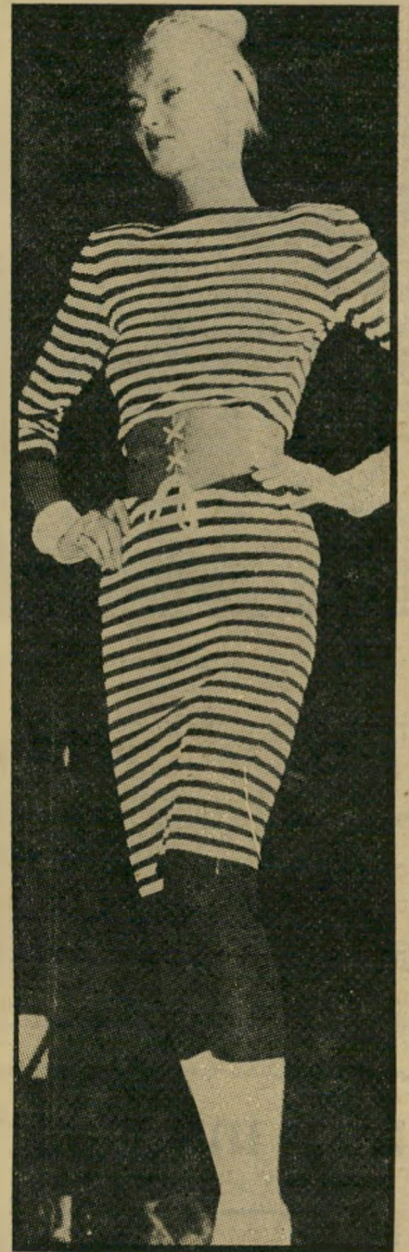
חגורת עור עם שרוכים

איך שהזמנים משתנים. הנה, בעונה הקודמת, כל אשה שרצתה להיות אופי- נתית החביאה את המיכנסיים עמוק עמוק