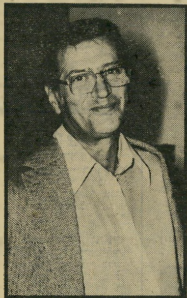
מנהל דשעבר פינסקר לחזור ביגלל המחיר

עוד לפני חודשים רבים הבטיח לבי"ארי לבנו, שתחת הגיגת בר-מצוה יקח אותו לטיול בארצות הברית. כאשר התבקש לבי"ארי לקבל עליו את תפקיד מנהל הרדיו,