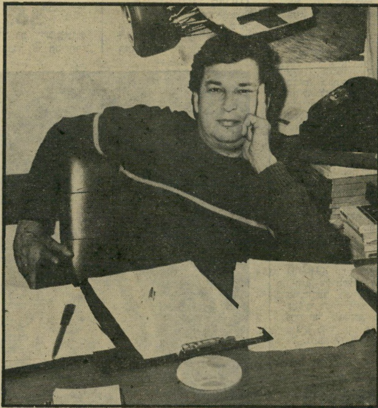
מנהל לבי"ארי חופשת חודש

כאשר פרש פינסקר, הוא הסכים עם הנהלת רשות השידור על פיצויי פרישה ומגדלים. פינסקר כבר מצא לו עבודה אחרת, כמנהל חברת התקליטים ס"בי"אס, אולם עתה הוא מאיים לבטל את התפטרותו ולשוב לרדיו.