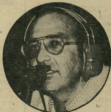
שדר גילעד חפסד כפול

ניה כי שידור זה, שהטיל עוצר בארץ, היה השידור בעל שיעור הצפייה הגבוה ביותר בתולדות הטלוויזיה בישראל. מיש"רד"התקשורת והנהלת רשות השידור עשי מאמצים כבירים כדי לאפשר את השידור, ובצבע, אולם גילעדי לא עשה מאמץ כדי לחרוג מהבינוניות האהובה כל כך על חובבי הספורט, וכדי להבין שלא רק קוראי הכותרות של עיתוני הספורט יצפו במישחק, אלא עם ישראל כולו.