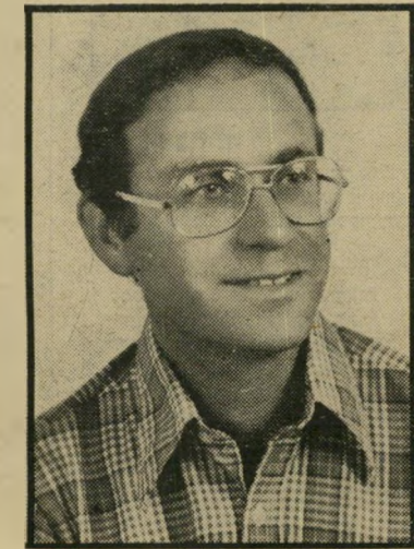
חבר-יועץ דויד המדינה הפסידה

בשנת 1978 היה יצוא היהלומים ליפן ממוצע של 15 מיליון דולר לחודש, הרי בפברואר השנה הוא קפץ ל-24 מיליון דולר.