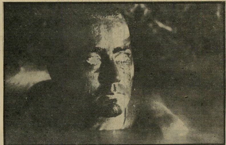
מרטין שין בתפקיד המחסל וילארד אל לב השממה האנושית

התחלת המסע, על ספינה שבה צוות של ארבעה אנשים, היא ריאליסטית למדי, אבל עד מהרה מסתבר שהדרך אינה מ"בילה רק אל לב היבשת האסיאתית, אל לב השממה האנושית ואל לב האופל, אלא גם אל לב הטירוף, סימן נורתמליים ב"רך, מפקד יחידת-מסוקים, שעוזר לספיי"נה לעבור עיקול מסוכן בנהר. כל מעייני, בין חיסול כפר אחד למישנהו, נתונים לשמירה על חזות של היים נורתמליים ב"תוך הגהינום, ובלב הפצצה הוא ממריץ את חייליו לצאת ולהחליק על הגלים, כמו שנהגו לעשות בבית, בחופי קליפורניה. לעומת גבורה מיותרת זו, המזכירה מעט את הטייס האמריקאי הרכוב על פצצת האטום בדוקטור טוריינג'לוב, אותו בטרט כולו. הוא מעלה את יחידת-המסוקים שלו לאוויר, משמיע דרך הרמקולים ה"מחורבים לכלי הטייס, בעוצמה אדירה, את רכיבת הוולקיריות של ואגנר, פוישט על כפר ויאט-נאמי, שהופך, תוך שניה, מישוב סתם, אייחורבות עשן. כל אלה