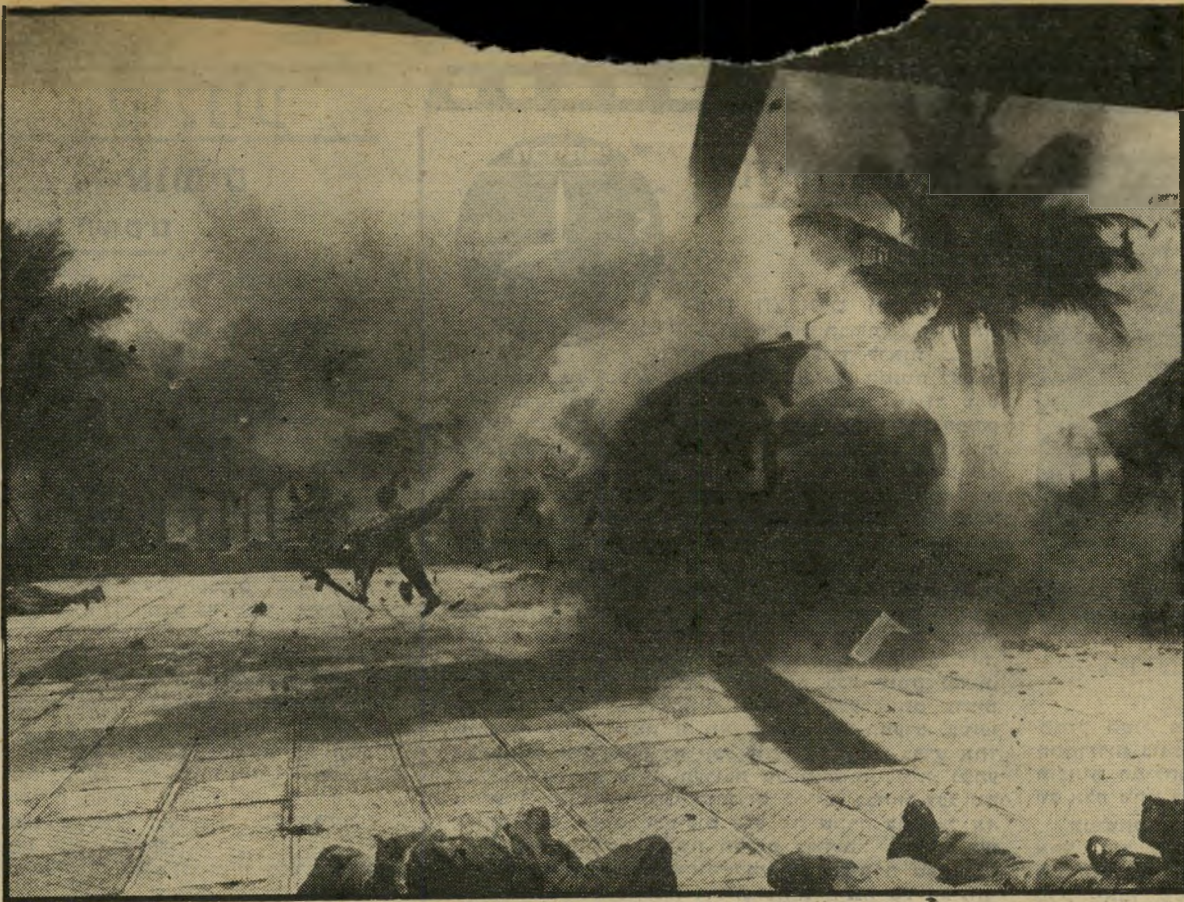
מפוק בוער וגוויות מתעופפות ממנו ב"אפוקליפסה עתה" ד"קל הזהב" ופרס הביקורת בקאן

במסיבת העיתונאים בקאן, התזיר קורפולה מגה אחת אפיים לכל מאשימיו. "העיתונות האמריקאית היא המושחתת והמנוונת בעולם", הוא טען. "אף מילה ש"נכתבה על הסרט שלי אינה נכונה." אבל, גם אם העיתונות השמיצה, היט עתה והרגיזה את קופולה, היא לפחות דאגה לכתוב כל הזמן על הסרט, ולעורר את הסקרנות סביבו, והסרט זקוק לכך כאוויר לנשימה. שכן, למרות הפאר והדר שملווים הפקה של עשרות מיליוני דולר (עד קאן, לדברי קופולה, עלה 30.5 מיליון דולר וזה עדיין לא המחיר הסר