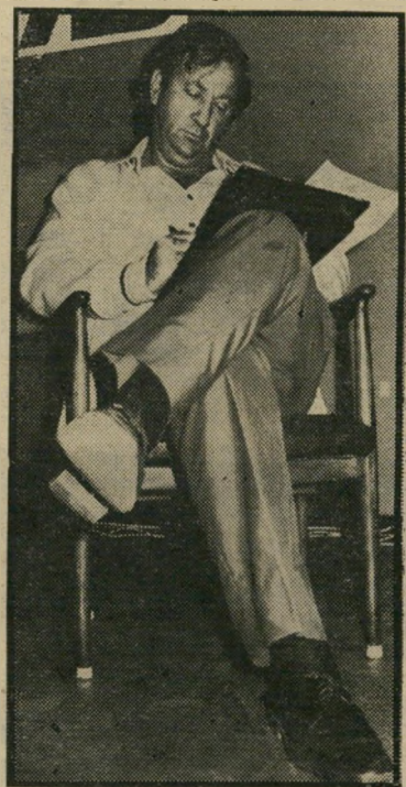
ח"כ פעיל תשלום של דוקטור