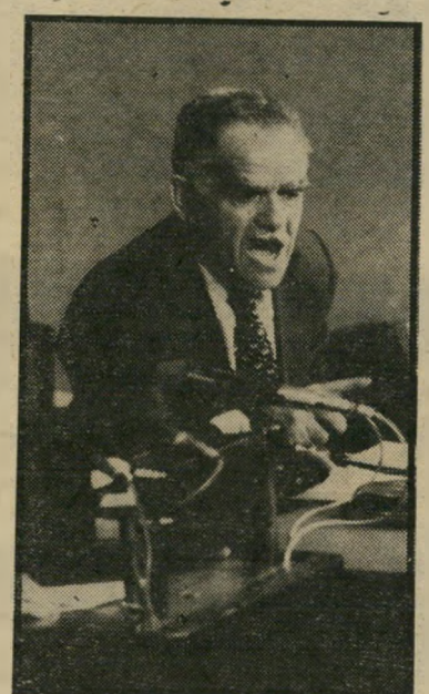
יו"ר שמור השקעה ארוכת-טווח

במערכות-הבהירות הקודמות למועצות המקומיות, עמד בראש רשימה עצמאית. כראש המועצות המקומיות הערביות, הצטרף מוויס לחזית-הדמוקרטית-לשלוש ולשיוויון, שהוקמה עלידי רק"ח ערב הב-