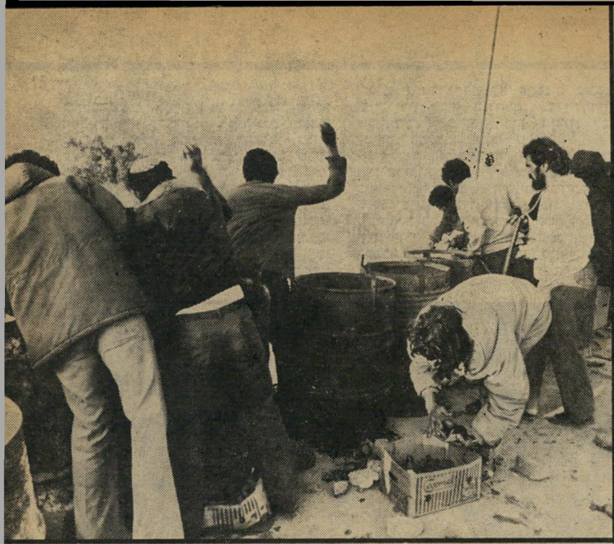
חצילים מן הגג חברי נאות סיני, יחד עם כוח עזר מגושיאמונים, ניצבים על גג הבניין וממנו חצילים ועג' בניות על חיילי צה"ל. בשלב מאוחר יותר הוטלו מהגג החיילים גם אבנים.