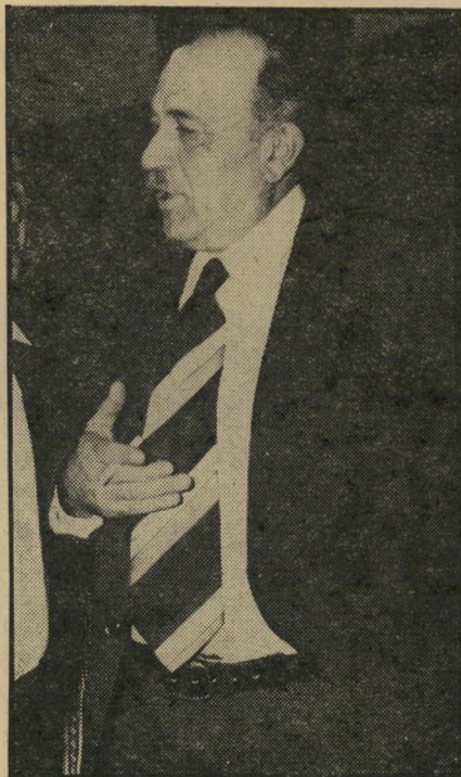
רביניצב תבורי חזרה לזיגל

במרץ רב בחקירת כל הפרטים שנמסרו. הצלחת החקירה עתה מעוררת מחדש את התמיהות, מדוע סירבו השוטרים לחקור כל העת את החומר. רק לפני כחודש מסר עורכי-דינו של עקביה, דניאל שרפמן, לזכריה בנאי, מפקד היחידה המרכזית בתל-אביב, את העובדות הנחקרות עתה. הלה סירב בהחלטיות לגעת בנושא, כשם שראובן מינקובסקי סירב אף הוא לפתוח את תיבת-ההפנדורה שהוגשה לו. החקירה שפתח בה בנימין זיגל מחדש יכולה להיות ראשיתה של הכביסה הגדולה במישטרה, שתחשוף שורה של קציני-מישטרה ה' משתפים פעולה זמן רב עם עבריינים, תמורת חלק מן השלל.