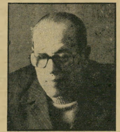
נגיב מחפוז דיכאון שלאחר מפלה