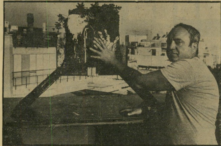
טביעת-יד עץ גושי-חימר מיכתם בצבע פירוטום ואהבת-הציבור אינם כרוכים יחדיו

טיפוסים משונים — לא דבק בו מאומה. הוא נישאר כשהיה, אם כי הוא טוען ש"שנותיו בפאריס ובבריסל, היו בית-הספר הטוב ביותר בחייו. כשצופים בתערוכה, מבחינים בשני סוגי גים של יצירות. האחד, משוחרר, עם גוני גונים של צבעים מעודנים וכיתמות רגיי-שה. הסידרה השנייה ממושעת יותר, קרה והגיונית. אך המשותף לכולן, הוא השימוש בעיפרון על רקע צהוב-עמום של הנייר, בשילוב של מריחת צבע שמן בשכב-בות עדינות ובשירבטים חופשיים.