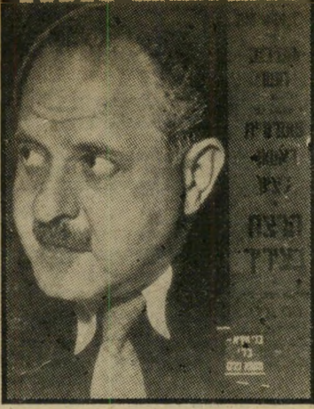
"העולם הזה" 865 תאריך: 20.5.54