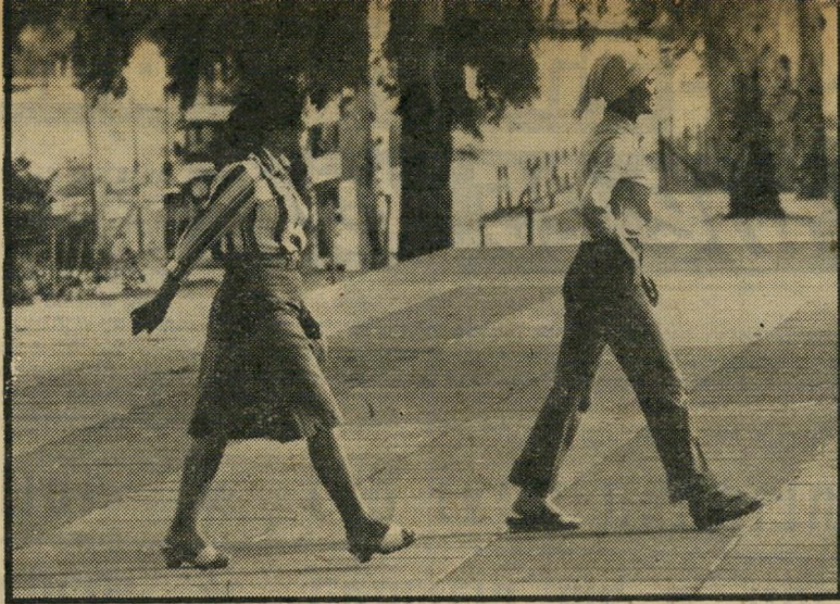
גננות ערביות מהגליל בבאר-שבע איפור, לבוש מודרני וציאה לביוליים

יעיף חטיב, מפקח מטעם משרד ה חינוך על איזור הדרום במיגור הערבי, מכיר את בעייתן של הגננות: "הגננות מהצפון באות אלינו בדרכי-כלל מחוסר