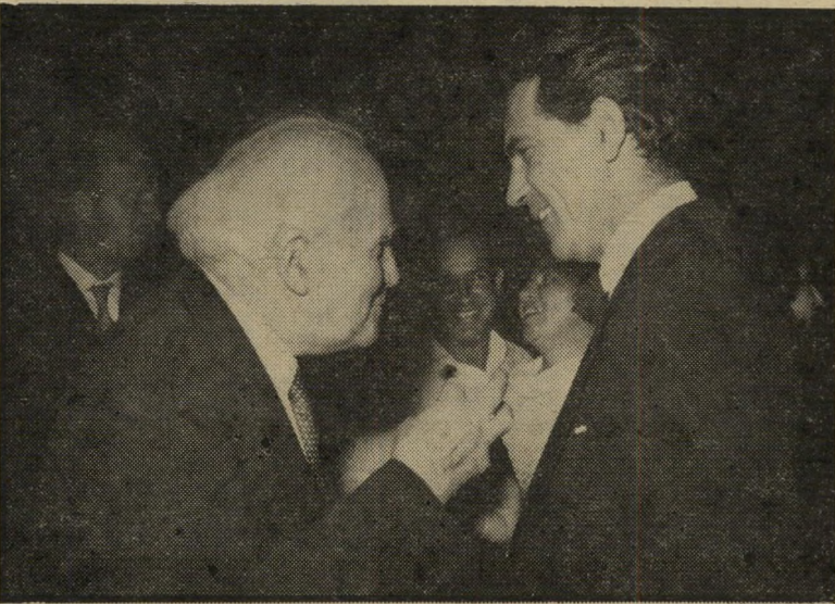
מיקוא עם בן-גוריון — ותוכניות —

"זה לא יקום ביום אחד", הוא סבור, "צריך אולי 10 שנים כדי שהתיאטרון יפתח את מלוא השפעתו". גם ההצגות יהיו במתכונת שונה: באולם גדול, עם כמה במות, והקהל ילך עם השחקנים מבמה לבמה. יהיו הרבה מיפגשים עם הקהל, קונצרטים ומופעים בשאר האמנויות, כי פפו חושב שיש פשע שהתיאטרון בארץ מצטמצם בעשיית בידור, בזמן שהוא יכול להיות אחד הגלגלים שעושים תרבות. מילוא קיבל כבר את פרס ישראל, את פרס תל-אביב, וכמה וכמה כינויות דויד. למה הוא חותר? משיב פפו: "תעובו את הפרסים. לא ליקקתי דבש, אני פייטר, אני אוהב להילחם ואני מקווה שהפעם לא אלחם לשווא, כי אני לא נעשה יותר צעיר".