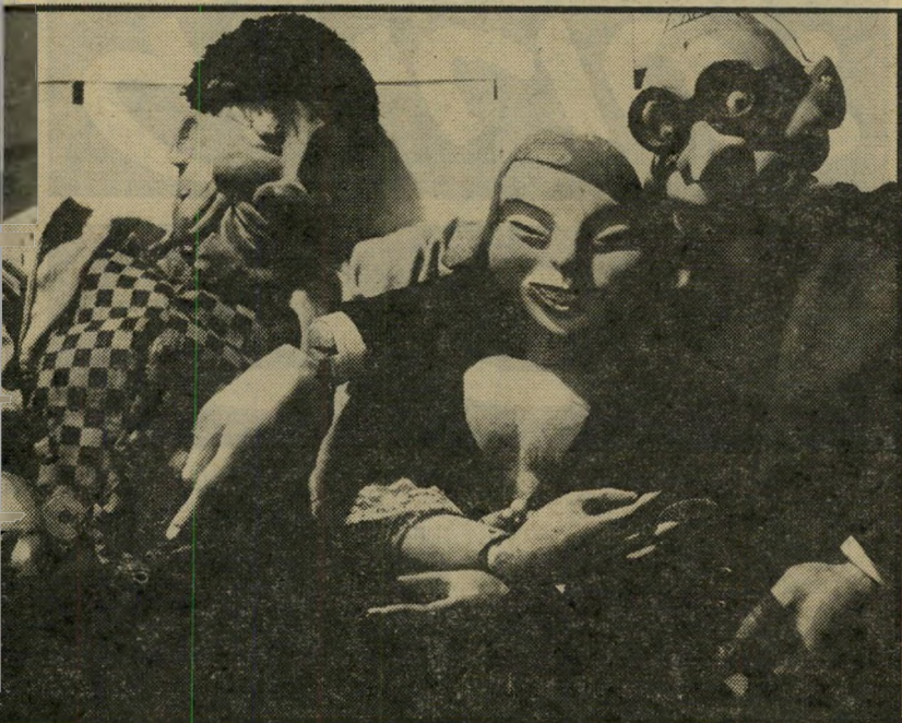
תיאטרון-הבובות שבו שימש מיזוא כקריין שבעה קולות שונים

כ די להבין את הרעיון, העשוי לחולל מהפכה בתיאטרון בארץ, כדאי לחזור כמה עשרות שנים אחורה, ולעקוב אחר האדם, שכמוהו כמתאגרף, סגן נוקד אוטוים לא מעטים, עבר תקופות משבר