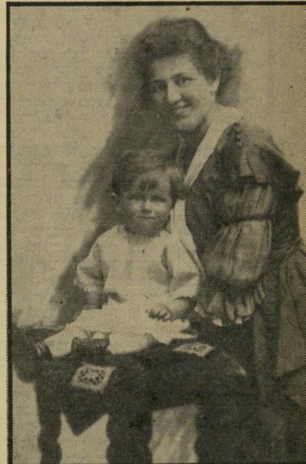
פפו (עם אמו) בתפקידו הראשון מתחת לגמל

את השראתו ספג באותם ימים מסירטי אדייפולס, הקאובי הנועז, שהוצגו בקול-