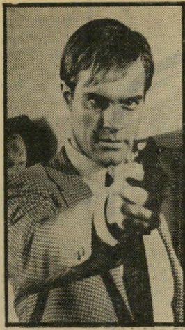
ריינמן: קודים שבת 10.10