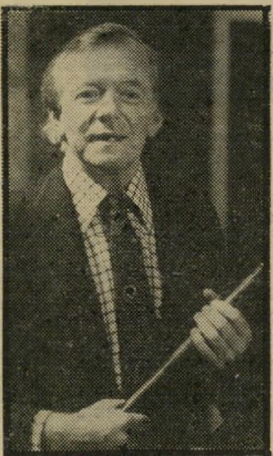
עבירה: בארקות יום שני שעה 9.30

ארי-עריש (8.00) . הטלוויזיה עדיין אינה יודעת מתי ואיך יועברו השידורים מגיקור אנואר אל-סאדאת בי אל-עריש ובבאר-שבע. ויש ל-הניח כי כל מערכת השידורים הרגילה שתשבש. גם ללא אל-עריש, כל השידורים של הערב הם כאלה שהיו צריכים להיות משודרים ב-13 בחודש ולא שודרו בגלל שבתה. השידור