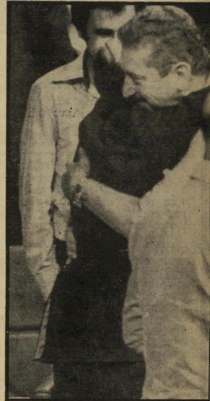
בגין ועזר ככנסת חיבוך אחרון?

האם היתה זאת הכרזת-מלחמה ראשונה של לווינסון ואנשיו? מי שמכיר את שני