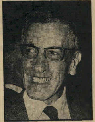
מבקר נבנצל רק לא למישרה

אחד מעובדי הממשלה, שכפיהם הוטחה ביקורת בדו"ח ה-29 של מבקר המדינה שפורסם לפני שבועיים, טען לפני המבקר כי לאיש שכתב עליו את הפרק בדו"ח יש חשבון אישי עימו, ש- אינו קשור כלל בעבודתו בממשלה, ולכן הוא פירסם דו"ח שאין לו כל קשר למצי-