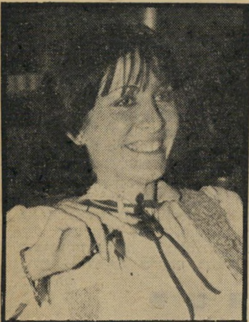
ראש-לישכה שמע אפשר גם בירושלים

שר-החקלאות אריק שרון, החליט להעביר את לישכתו המרכזית לירושלים. עד כה היתה הלישכה הראשית של שר- החקלאות בקריה בתל-אביב.