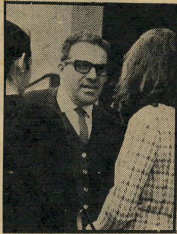
בעל מיפעל שוורץ המנכ"ל ידווח

מיפעל-החלבאים, המעסיק כ-350 עוב- דים, נמצא שוב בקשיים. עד כה הגיע