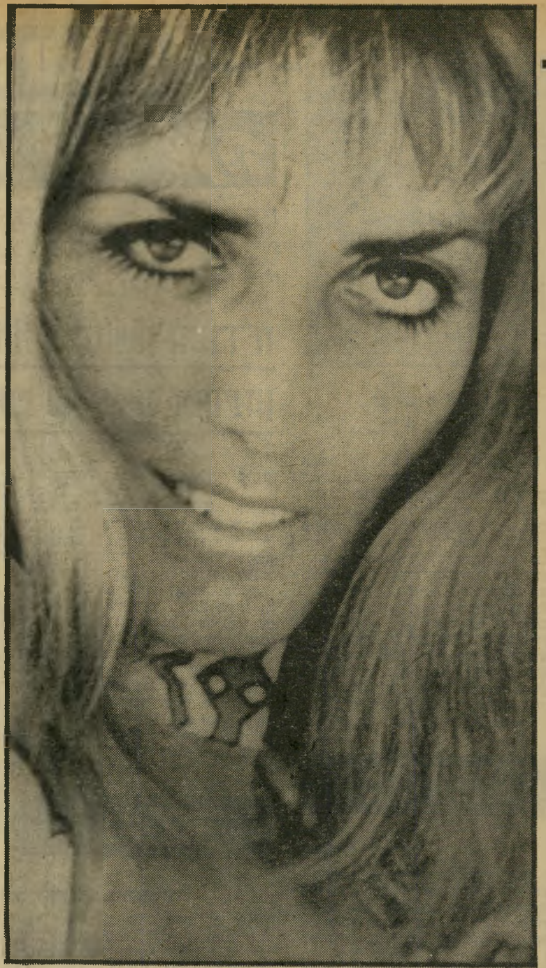
קסאוירה הולנדר בנעוריה לא לנשים בלבד

לתנוחה שבה שוכבת הבחורה על גבה, פושקת את רגליה והבחור שוכב ביניהן? הארי נוקש באצבעותיו. "בחי, עכשי ואני נזכר! זאת התנופה שלידי גיין הר-אתה לי". ● "אתה באמת רוצה אותי?" הדבר משול לשליפת גוף מחוץ לחלוטין מתוך מכונית מחוצה רק כדי לשאול את בעליו "בפצעת?" אחרי הכל, הוא עושה לך אהבה, לא? מה עוד הוא יכול לעשות? ● "אני טובה בשבילך?" המישפט הגאוני הזה מצוי בעמוד 331 של פייטון פלייט, שהופיע בשנת 1956. גשים רבות עד להחריד למדו אותו בעל-פה. ולגברים רבים במיספר שווה עד להחריד כבר יצא מהאף לשמוע את השאלה המטופשת הזאת של קונסטנס מקנדי.