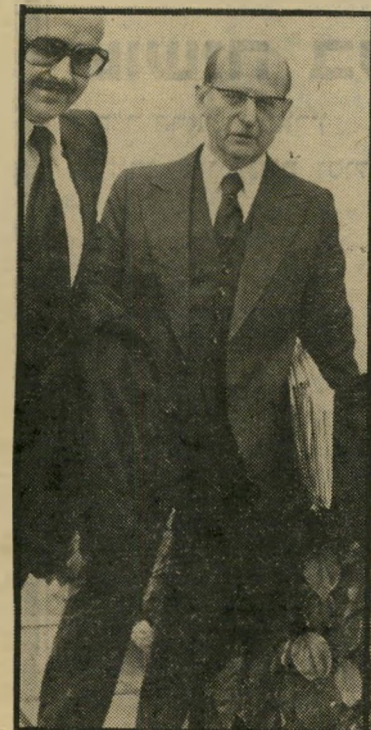
פרקדנט מיכאל כספי לא לפרוטוקול!

פי קובץ התקנות של שרות בתי הסוהר מה-17 באוגוסט 1978 לא היו