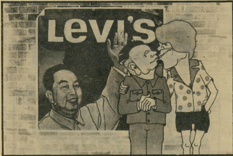
כל העולם אחים נשיקה מערבית

קובה, שהופכת בהדרגה למעצמה קול-נועית, שלחה צרור שלם של סרטי תעמולה, שחלקם עוסק בתיירות. אורח כבוד בפסטיבל היה במאי קובני בשם סנטיאגו אלורו, וסביבו פרצה גם הרשעוריה הקטנה היחידה של אובראהאוזן. אלורו, שנחשב לאישיות בולטת בין עושי הסרטים הקצרים בעולם, הביא עימו סרט תיעודי חדש, שבו הוא מצדיק את הפלישה היוויטנאמית לקאמבודיה, ומגנה את הפלישה הסינית לוייטנאם, לפי כל החוקים של סרטי התעמולה הסטלי-ניים. במסיבת עיתונאים שנערכה לאחר מכן, אמרו לו הגרמנים שהוא אולי קול-נוען גדול, אבל פוליטיקאי קטן. אלורו איבד את עשתונותו, השתולל, צעק ורשליך בקהל את כל כינוי הגנאי שי אפשר לשמוע בשידורי-תעמולה מן הר