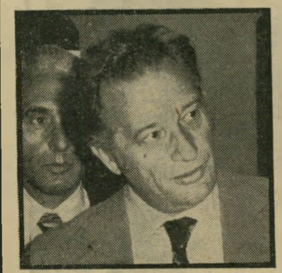
דוקטור שניצור תמורת מיליון דולר

נשיא בורסת-היהלומים, משה שני-צור, יקבל תואר דוקטור-כבוד מן הפקולטה החדשה למינהל-עסקים, שתקים אוניברסיטת בריאילון. נמסר כי האוניברסיטה קיבלה הבטחות, שהיהלומנים יתרמו לה כמיליון דולר.