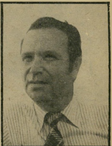
שר פת הריסל בוטל

המבקר מצא גם אי-סדרים בחשבונות החברה, ואי-התאמות רבות בין סכומי הפרמיות, הנגבים בפועל, לבין הרשום בספרים. החברה מחזיקה את כספיה בחשבון ב"בנק דיסקונט", ויש לה פית רות-זכות ממוצעות של יותר מ-50 אלף לירות. אין היא מזוכה בריבית על יתרות אלה.