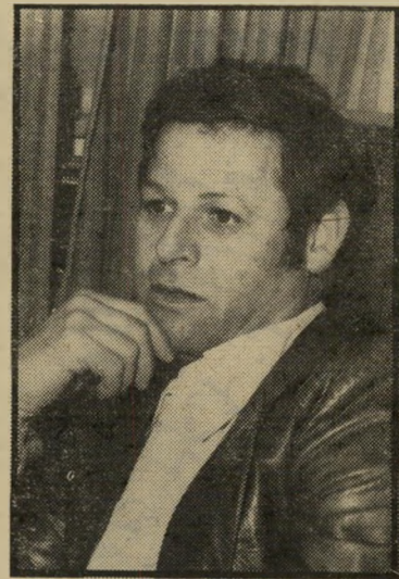
מנהל מחלקת יבין שיפוט מהיר