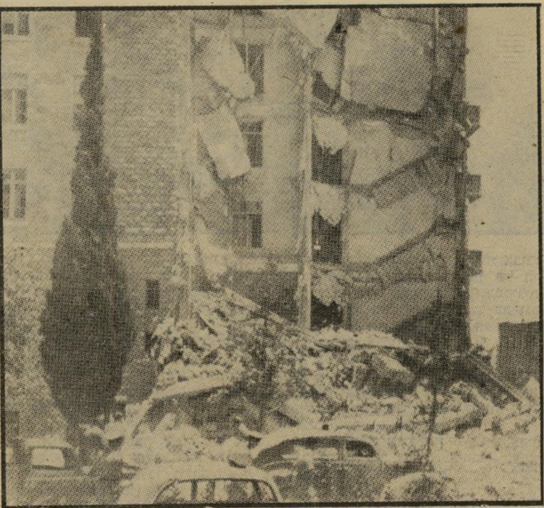
מזון המרד-דודי אחרי הפיצוץ (1946) האם די בהודעה מוקדמת?

רציונליים נגד עונש-המוות, קמה באולם המולה שגבלה בטירוף. אילו היה צלם מנציח את המראה שנתגלה לעיני, היה התצלום מראה מאות פנים מעוותות בשינר אה ובועם רצחני. בסוף הדיון נערכה הצ-בעה, ורוב עצום הצביע בעד המוות. אילו הוכנס לאולם באותו רגע נער ערבי שזרק פצצה בשוק, היה הקהל מצביע בעד הור-פצתו להורג לאלתר, ואילו הוצע להורג