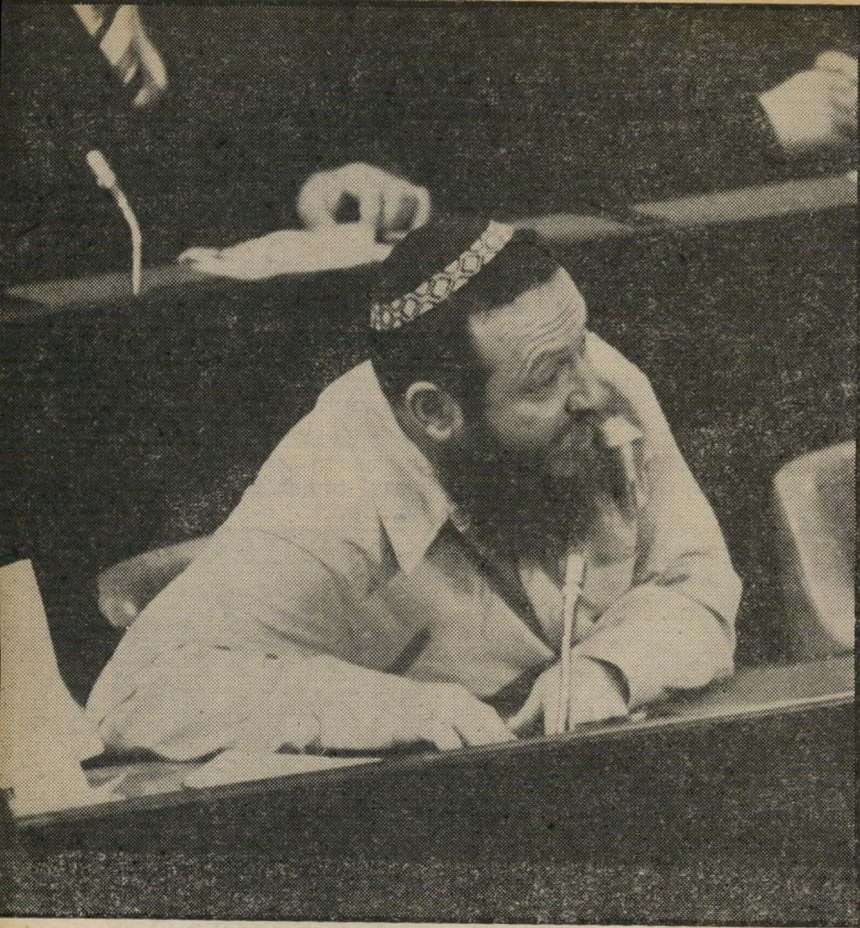
ח"כ הרב דרוקמן למצוא את מקומו באחת ההתנחלויות