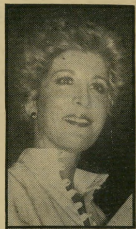
סוד כמנס: מזור שעה 5.30

● רצח לפני המצלמה (10.15) . הצלמת מרסי פלטי שר, שאותה מגלמת השחקנית בריט לינד, מזמינה את מיודי