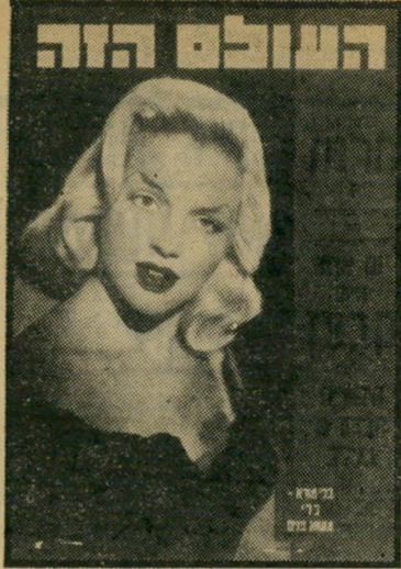
"העולם הזה" 862 תאריך: 29.4.54

רית, והדובר עברית רק כאשר דורשים זאת ממנו במפגש. הסרט מתאר ארבע אפיונות מחייכם של ארבעה לוחמים ש"נפלו על גיבעה 24.